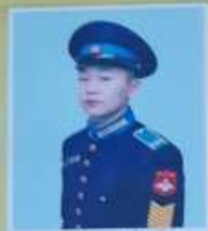
Отдар М.М. поступил в 2014 г.